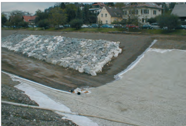
Schichtaufbau der neuen Böschung

Andererseits wird ein Verschieben der Überlappungsbe- reiche, z.B. durch schwere Baumaschinen, verhindert.