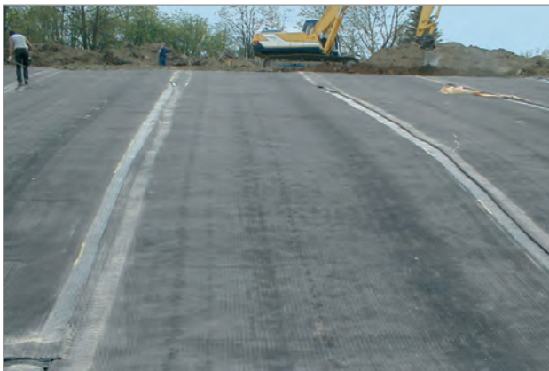
Fixierung der Überlappung der GTD mittels Spezialkleber