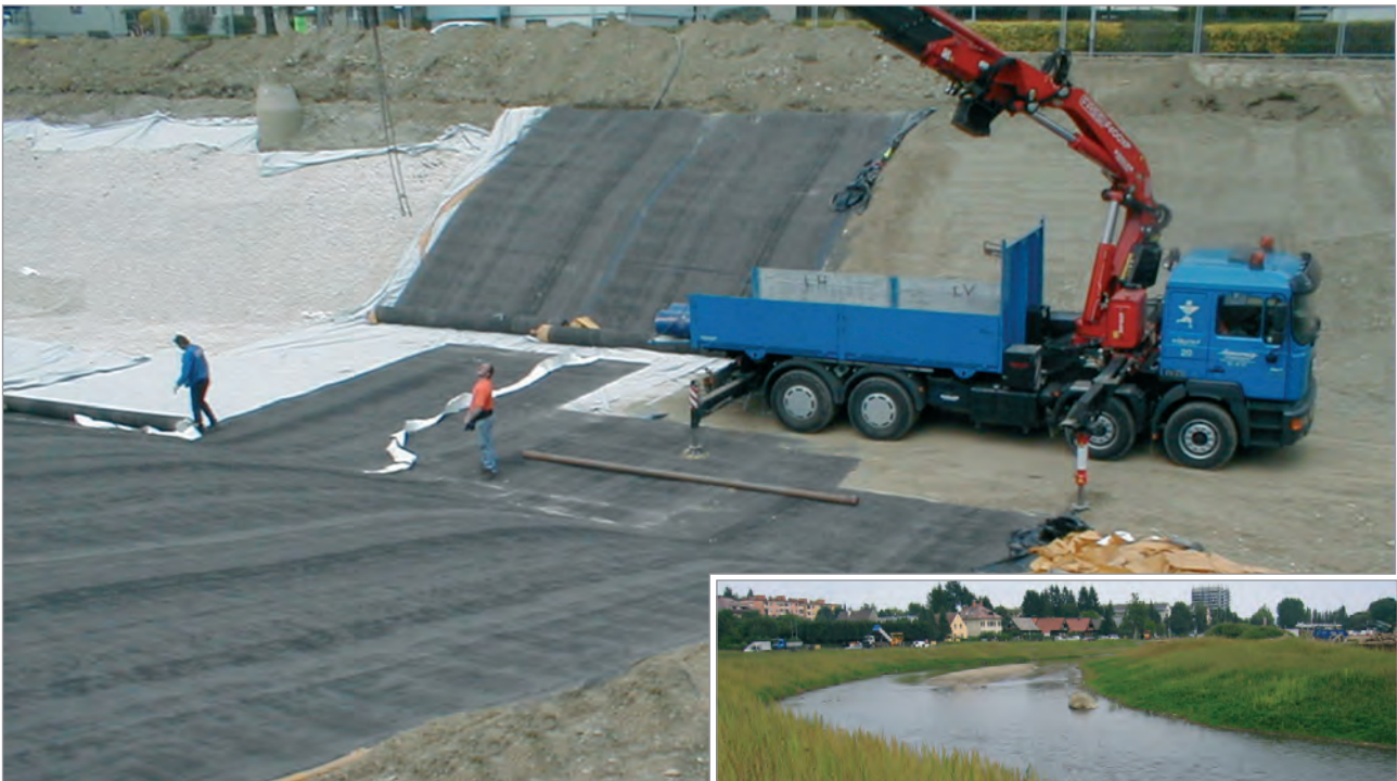
Ausrollen der GTD NaBento® im neuen Flussbett