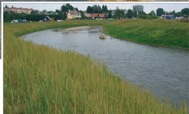
Das neue Glanflussbett - nach Fertigstellung

Aus diesen Gründen entschieden sich die Planer für NaBento® RL-N. Diese wird beiden Bedingungen vor Ort gerecht. Sie erfüllt die notwendige Abdichtung zwischen Fluss- und Grundwasser und oberhalb der Wasserlinie kann das Wurzelwerk von Bäumen und Sträuchern die Bahn durchdringen.