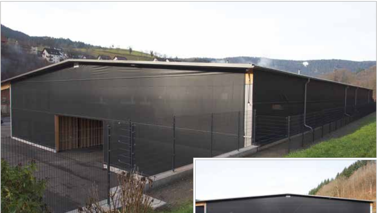
Tectura Fassadenverkleidung an einer Lagerhalle