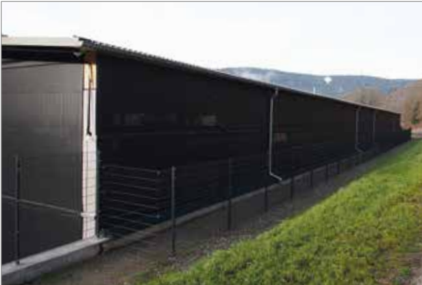
Seitenverkleidung mit Tectura