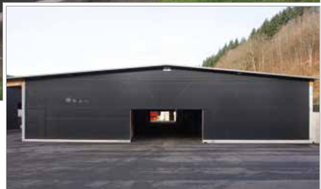
Giebelverkleidung mit Tectura

Die bauausführende Firma hat in Zusammenarbeit mit HUESKER eine Lagerhalle für die Paletten und Ladungsträger geplant und aufgestellt. Diese wurde an beiden Giebelseiten über eine Breite von 40 m sowie an einer Längsseite von 70 m mit Tectura Fassadenverkleidung Typ 60/60-1 in der Farbe Schwarz ausgerüstet. Der Betonbauer hat die Befestigungsschienen für die Windschutznetze