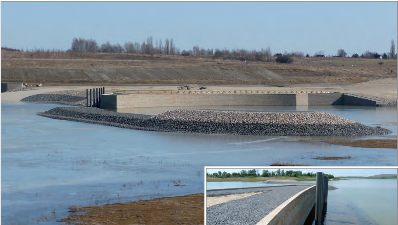
Übersicht Segelhafen Grunaer Bucht

Einsatz von Fortrac® MP beim Neubau einer Kaianlage