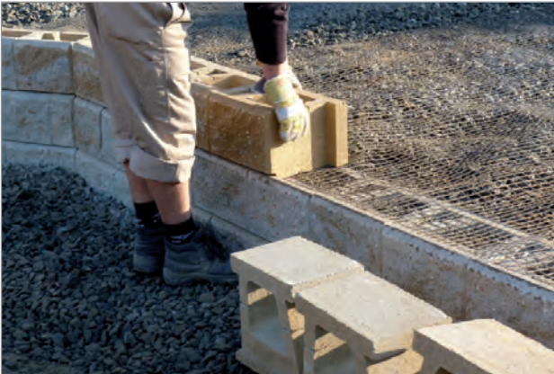
Einbau der Geokunststoffbewehrung