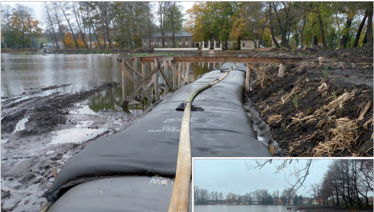
Verbaulinie aus SoilTain Entwässerungsschläuchen während der Bauzeit