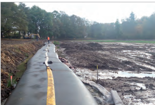
Schläuche (hier während der Befüllung) als Verlauf der neuen Uferlinie

Neben dem Neubau des Auslassbauwerks stellten die Erdarbeiten einen wesentlichen Anteil bei der Sanierungsmaßnahme dar. Bei der Umgestaltung des Schmelzsees wurde ein Ausführungskonzept gewählt, bei dem der See entleert wurde und 8.000 m 3 der im See angelandeten Bodenmassen wiederverwendet werden konnten. In unzureichend tragfähigen Bereichen wurden die vorhandenen Sedimente mit Hilfe eines Saugbaggers gefördert und über Spülrohre abtransportiert.