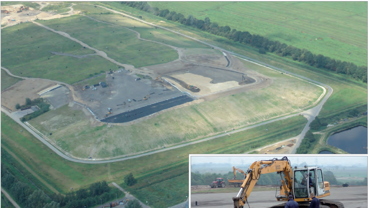
Luftaufnahme Deponie Ecklak während der Baumaßnahme – Oberflächenabdichtung BA II - 2011

Erstellung eines Abdichtungssystems mit NaBento® RL-N