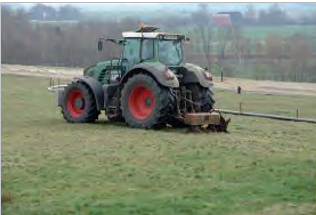
Perforierung der vorhandenen KDB