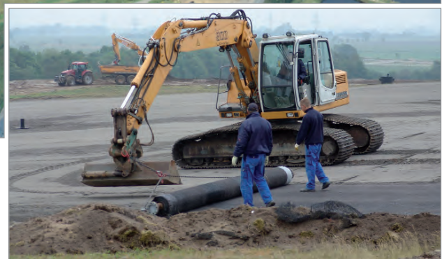
Einbau der GTD mittels Bagger und Traverse

Zur Vorbereitung der Installation des Abdichtungssystems wurde die temporäre Oberflächenabdeckung im Bereich der vorhandenen Entwässerungsmulden bis zu den Unterhaltungswegen vollständig rückgebaut. So sollte eine Wasserauf sättigung der Auflagerschicht während des Baus