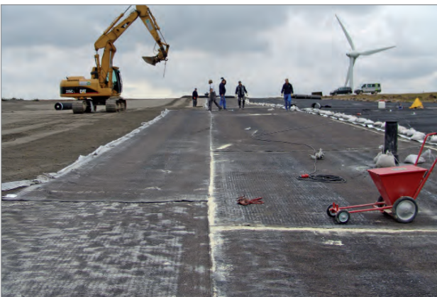
Hergestellte Längs-, Querüberlappung und T-Stoß