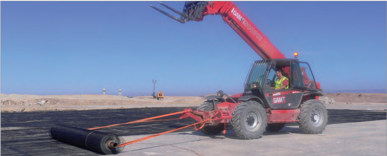
Ausrollen und Verlegen von Fortrac® R 200/20-30 MP Geogitter und Detail der Überlappung

Der zu erwartende maximale Trichterdurchmesser betrug 1,0 m und es wurde davon ausgegangen, dass über diese Hohlräume eine Schüttung von maximal 2,6 m Höhe erforderlich sein würde. Der Entwurf erfolgte auf der Basis des British Standard BS 8006:1995. Der Vorteil dieser Methode besteht darin, dass Oberflächensetzungen durch Deformationen im Geogitter vorhergesehen werden können.