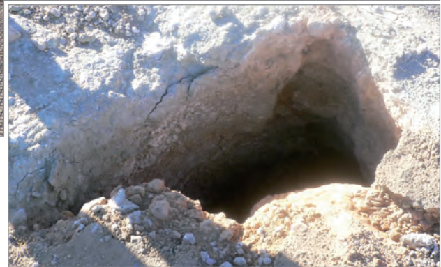
Bei den Bauarbeiten entdeckte Erdfälle