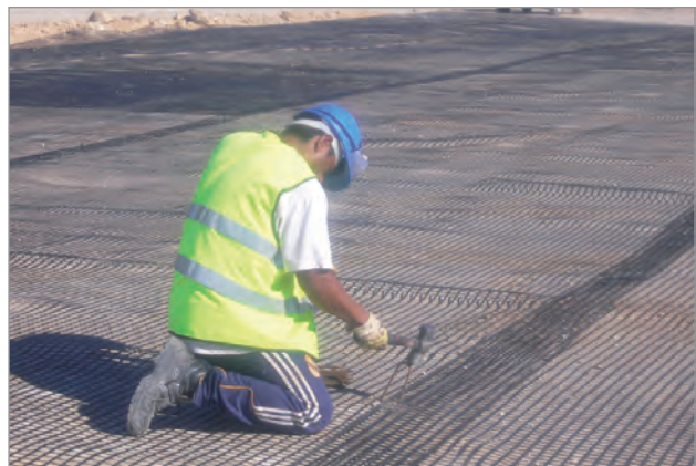
Verankerung der Überlappungszone mit Klammern

Die Verankerung des Geogitters erfolgte quer und längs mithilfe von Metallklammern. Das Schüttungsmaterial wurde in Schichten von ca. 50 cm so ver-