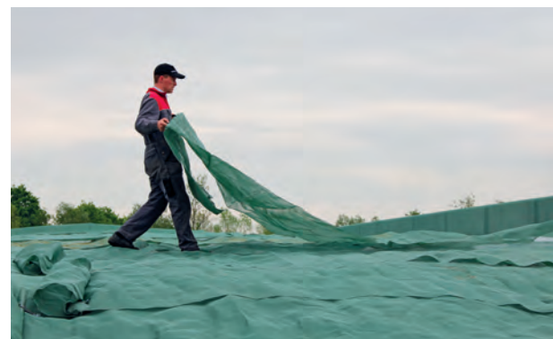
Schritt 3: Nach dem Einlagern der Silage werden die Gewebekonstruktionen über das Silo gezogen.