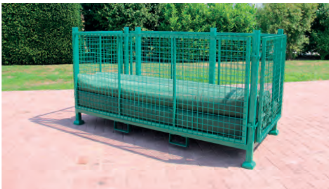
Gitterbox für nicht benötigte Gewebekonstruktionen.