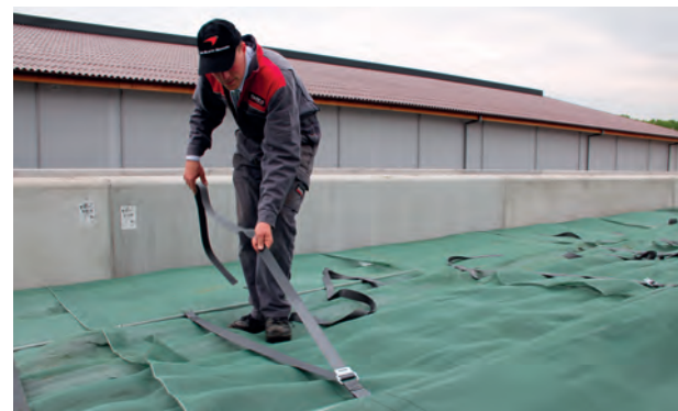
Schritt 4: Mit Ratschen und Spanngurten werden die Bahnen gespannt.