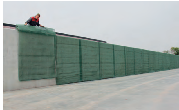
Schritt 1: Die Gewebekonstruktionen werden an beiden Seiten des Fahrhilos mit 25 cm Überlappung ausgelegt.