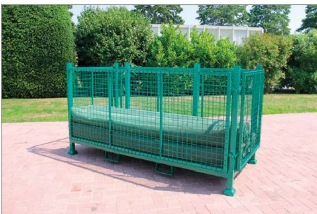
Gitterbox für nicht benötigte Gewebekappen