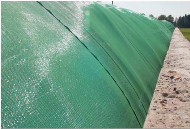
Vollflächiger Abschluss insbesondere an den Rändern