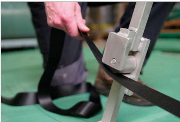
Einfaches System mit Spanngurten, Spannhebel ist inklusive