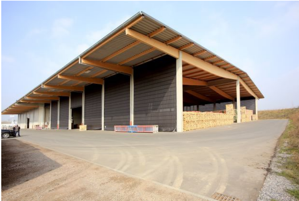
Bild 2: Lösungen für große Öffnungen und eine hohe Lebensdauer zeichnen die Produkte aus

Das Bildmaterial können Sie sich in Druckauflösung hier runterladen: