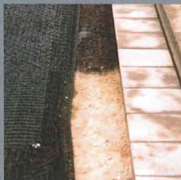
v.l.n.r.: Rissige Binder- und Tragschicht vor der Sanierung 2009 – Querriss im Randbereich 2009 – Längsriss im Randbereich Verlegte Bewehrung