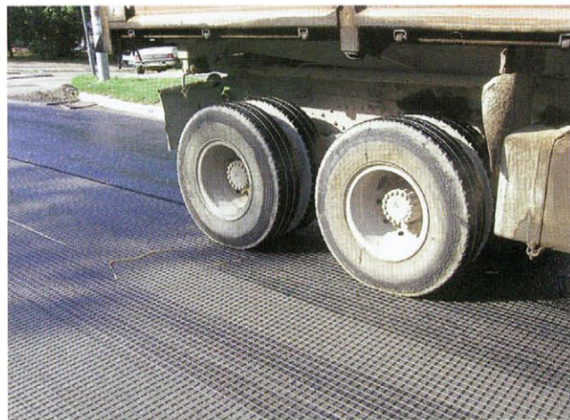
Bild 4. Befahren von HaTelit C 40/17 mit Mischgut LKW