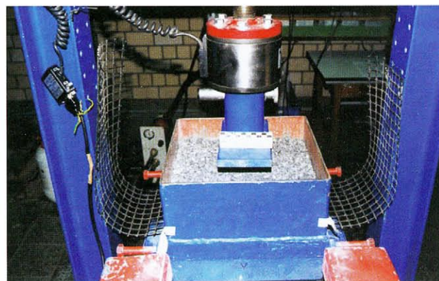
Bild 5. Versuchsaufbau