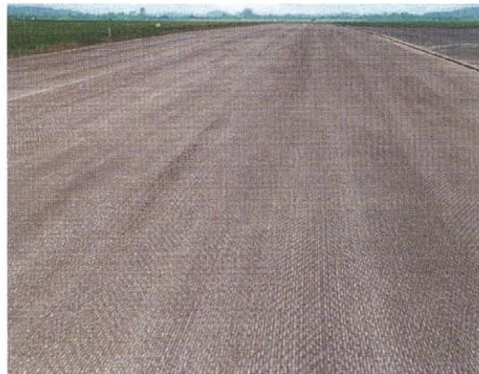
Bild 1. gefräste Fläche als Unterlage

Tabelle 1 zeigt die Ergebnisse von Prüfungen an Bohrkernen am Beispiel der Baumaßnahme Flugplatz Jagel, die 1998 ausgeführt wurde und sich bis heute in vollem Umfang bewährt hat. Auf einer gefrästen Fläche ( Bild 1 ) wurden 0,5 kg/m 2 Bitumenemulsion U 70 K aufgebracht und anschließend HaTelit C 40/17 verlegt. Die Einbaudicke betrug 4,0 – 6,0 cm. Vier Wochen nach dem Einbau wurden die ersten vier Bohrkern gezogen ( Bild 2 ), wovon einer als Referenzprobe nicht bewehrt war.