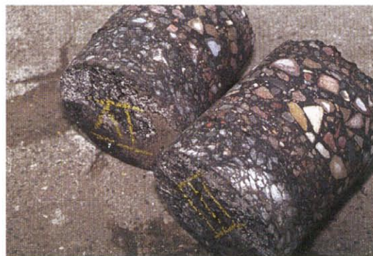
Bild 2. Bohrkern mit Gittern

Die geprüfte Scherkraft ist bei allen Bohrkernen sehr hoch und in diesem Fall bei den bewerten Proben sogar höher als bei der unbewehrten Probe. Hieraus kann jedoch nicht abgeleitet werden das HaTelit C 40/17 den Haftverbund erhöht, es verdeutlicht aber, dass der Haftverbund nicht wesentlich reduziert wird.